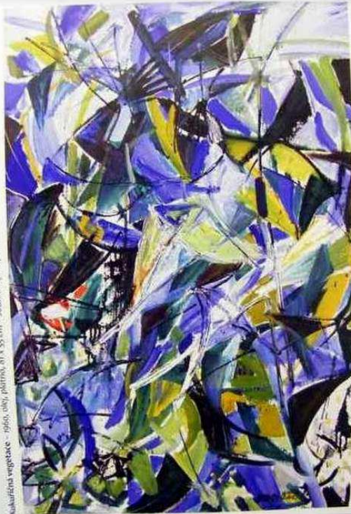
Kulturní vegetace - 1960, olej, plátno, 81 x 55 cm - soukromý majetek