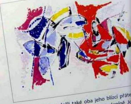
Vztah 1983, kvaš, papír, 59 x 84 cm galerie výtvarného umění v Hodoníně