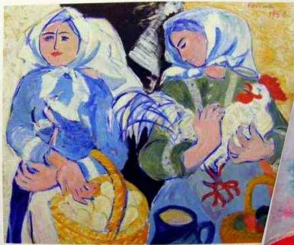
Ženy na trhu 1956, olej, plátno, 81 x 100 cm Galerie Slovákého muzea