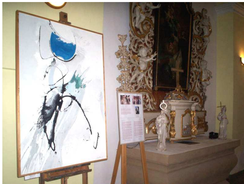
Z expozice výstavy „Slavnost zvonů“