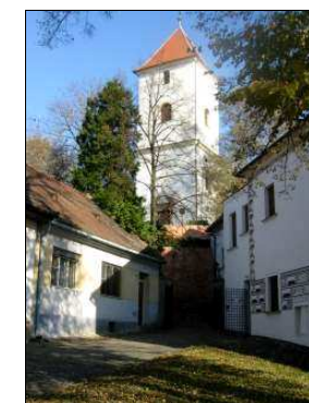
Kaple Sv. Josefa v Kyjově 2007