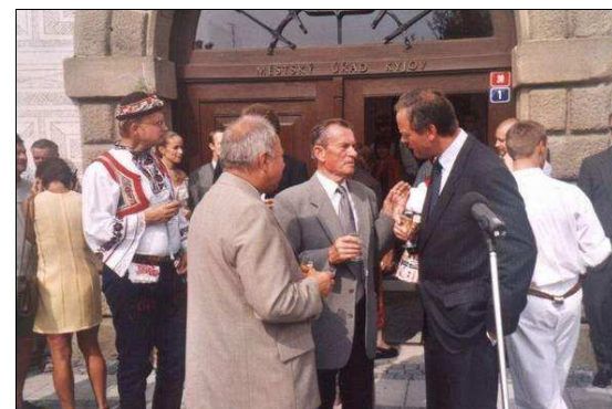
Slovákcký rok v Kyjově 2003

Tou první je vzpomínka na den 24. května 1970 v Kyjově a to na slavnostní svěcení a zavěšení dvojice nových zvonů na věži kaple Sv. Josefa, pod kterou se výstava koná. Její název Slavnost zvonů propůjčuje obraz, který malíř namaloval ještě toho dne jako osobní výtvarnou reakci. Zároveň jde o připomenutí rozsáhlé celoživotní restaurátorské činnosti, kterou umělec v souběhu s vlastní tvorbou vykonal. Výstava je ale především upozorněním na hlubší i vyšší složky našeho života, na otázky i potřebu lidské víry jakéhokoliv pozitivního směru. Jsme tak před abstraktním ztvárněním skutečností ve své podstatě rovněž abstraktních, tedy v místech, kde všechny otázky i odpovědi by měly zůstat jen nám samotným, ač jsou nám zároveň společné.